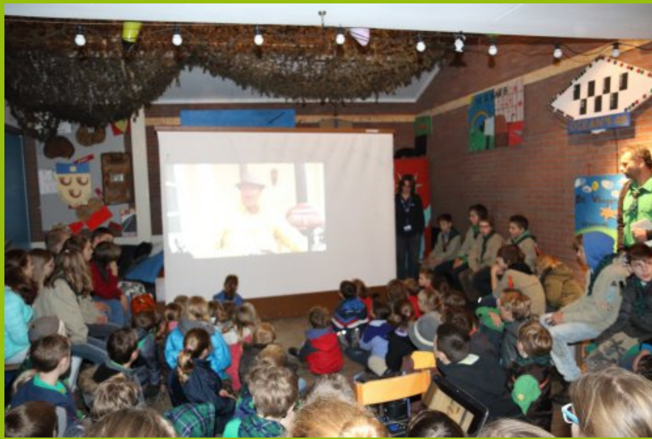
Thema opening op 17 oktober 2015

Hallo jongens en meisjes van scouting Rudyard Kipling, ik ben gevraagd door zowel ASML als de TU/e om voor hen te komen werken aan een zeer geheim project. Hier heb ik mijn hele team voor meegenomen, maar wij kunnen het natuurlijk niet alleen. We hebben jullie hulp nodig. Voordat ik ga vertellen wat dit geheime project is, ga ik jullie een stukje hele belangrijke geschiedenis vertellen. Het gaat over Rudyard Kipling en Robert